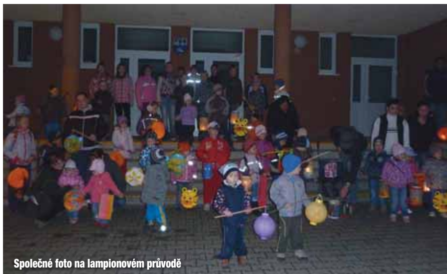
Společné foto na lampionovém průvodě