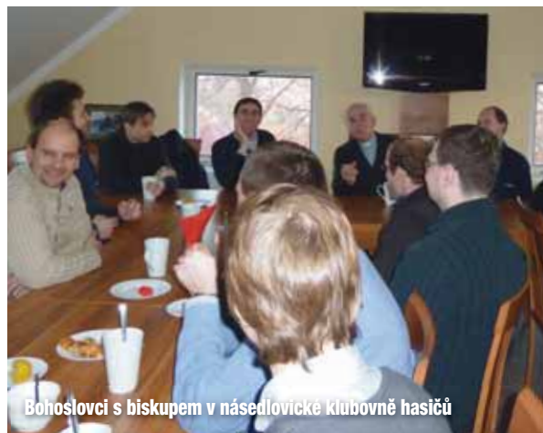
Bohoslovci s biskupem v násedlovické klubovně hasičů