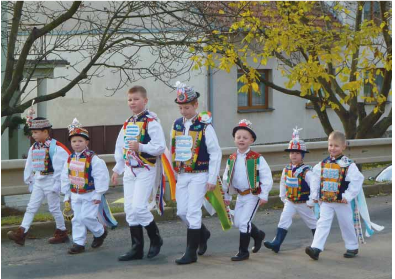
Už dorůstá nová generace stárků