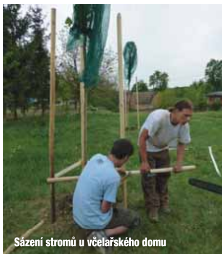
Sázení stromů u včelařského domu

met, v němž se ve směru otáčení automaticky obrací všechny rámečky s medem. I zde si mohli zájemci zkusit odvíčkovat plásty a vytočit si med. Před včelařským domem byly vysazeny různé druhy stromů a vznikl zde malý parčík. Jako na každé významné události ani tady nesměla chybět