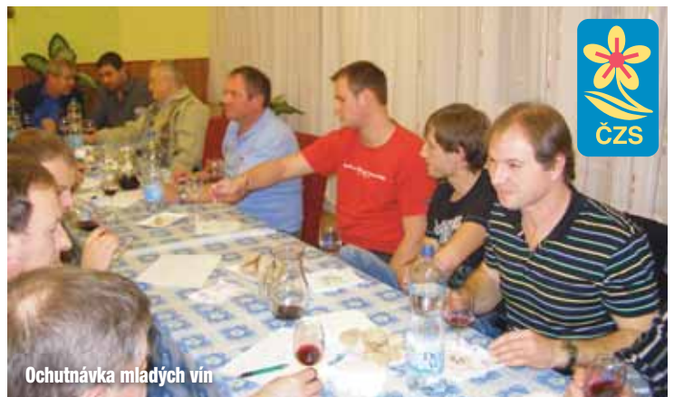
Ochutnávka mladých vín