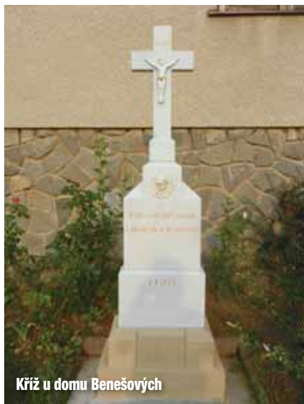
Kříž u domu Benešových

Na našem kostele se věžní hodiny objevily v roce 1929, kdy je ze svých prostředků zaplatila obec. Hodiny sloužily až do roku 1968, kdy firma z Vyškova instalovala nový stroj a vyměnila i tři ciferníky (na severní straně věže se s hodinami nepočítalo, jelikož tam nestály žádné domy). Během půlstoletí i tento stroj si své odsloužil, a tak v letošním roce byla vyměněna pohonná jednotka. Nyní, když se po 80 schodech a dvou žebříkách dostanete až nahoru na věž, najdete zde zařízení velikosti krabice od dětských bot, které snímá z družice