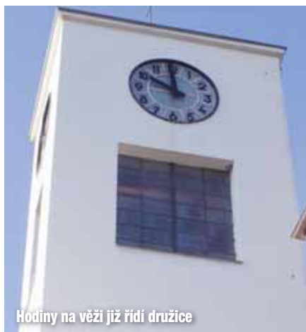
Hodiny na věži již řídí družice

Měření času v minulosti probíhalo mnoha způsoby, žádný však nebyl spolehlivý. Až po roce 1400 se začaly v Itálii stavět ve velkých městech orloje, u nás první orloj byl postaven v roce 1412 v Praze. Orloje si pořizovala velká města a bohatí šlechtici. U nás se jich příliš nezachovalo – obnovenému orloji v Olomouci snad schází jen srp