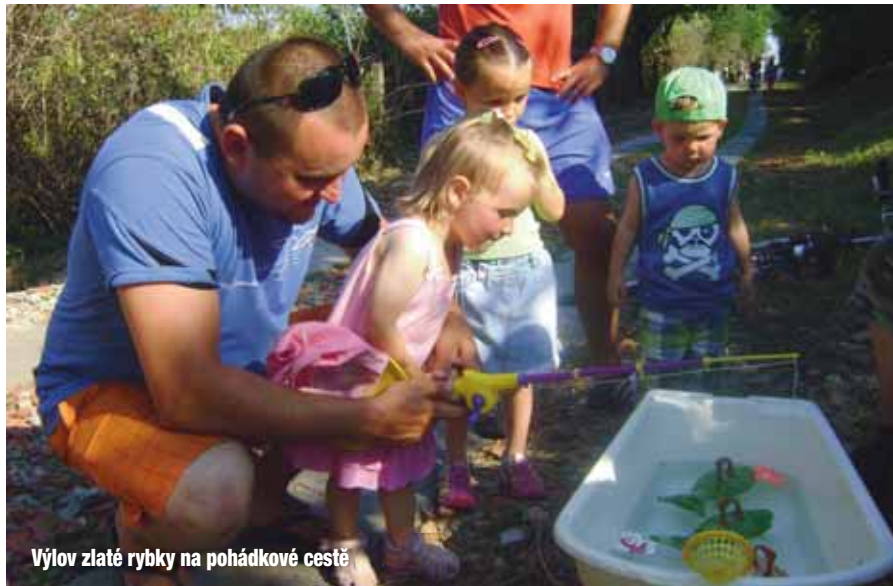
Výlov zlaté rybky na pohádkové cestě

a opečené špekáčky. Počasí nám přálo, a tak se nedělní odpoledne vydařilo. Děkujeme všem členům SDH za přípravu zázemí a vám všem, kteří jste jakkoli přiložili ruku k dílu ať už v roli pohádkových bytostí, nebo jinak. Žádná pomoc není malá.