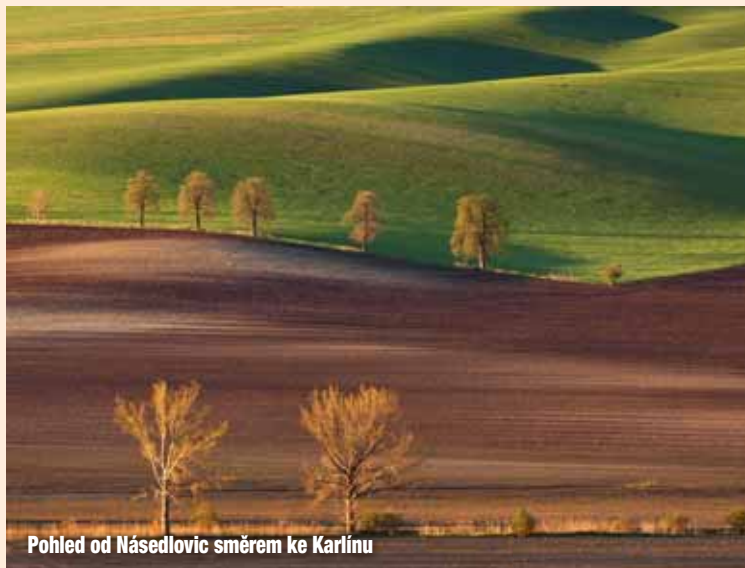
Pohled od Násedlovic směrem ke Karlínu