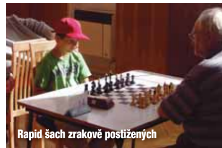
Rapid šach zrakově postižených