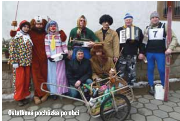
Ostatková pochůzka po obci

Rok 2012 se chýlí ke konci a v příštím roce oslaví naše tělovýchovná jednota již osmdesát let od svého založení. Ale vraťme se zpět k právě končícímu roku. Co se v jeho průběhu událo? Začali jsme jej 8. ledna v pohostinství Na kopečku, kde proběhla za hojného počtu členů výroční členská schůze.