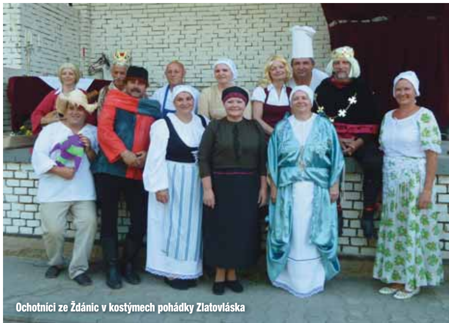
Ochotníci ze Žďánic v kostýmech pohádky Zlatovláska

Ve středu 24. října se konal další Rej světlušek. I když letošní úroda dýní nebyla nejlepší a navíc byla jejich životnost velmi