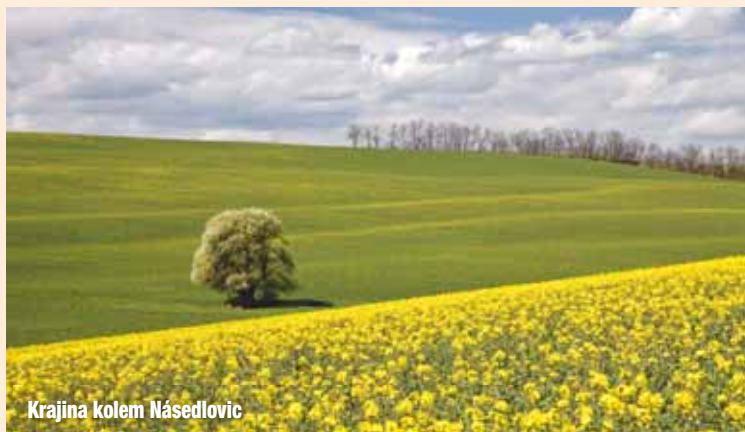
Krajina kolem Násedlovic