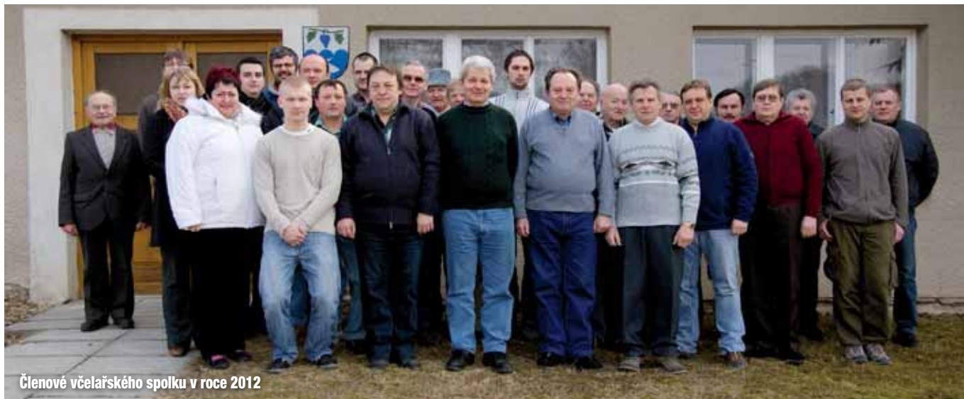
Členové včelařského spolku v roce 2012

met, v němž se ve směru otáčení automaticky obrací všechny rámečky s medem. I zde si mohli zájemci zkusit odvíčkovat plásty a vytočit si med. Před včelařským domem byly vysazeny různé druhy stromů a vznikl zde malý parčík. Jako na každé významné události ani tady nesměla chybět