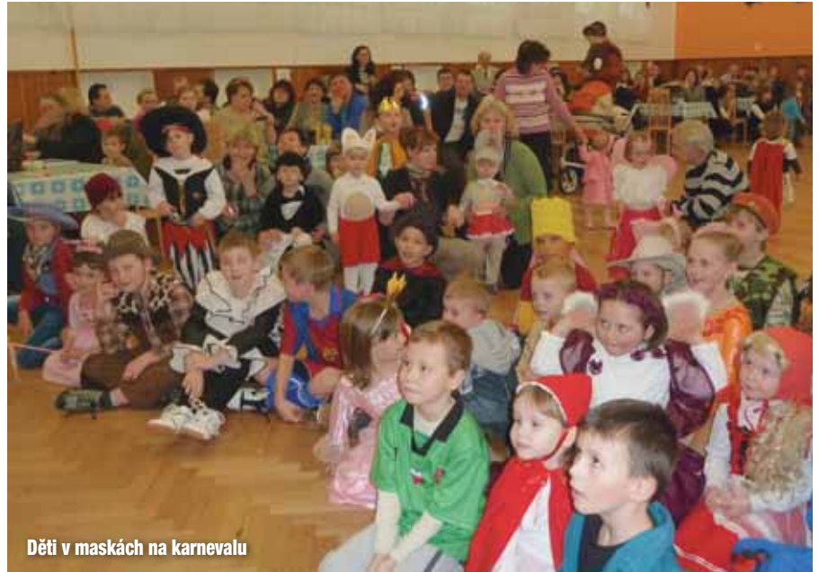
Děti v maskách na karnevalu

zahradní slavnosti Rozloučení s předškoláky. Letos jsme také vybudovali bylinkovou zahrádku, na které si samy děti budou pěstovat bylinky pro školní jídelnu. Peněz není nikde nazbyt, a proto jsme byli velmi rádi, když nám materiál na stavbu zahrádky poskytl pan Horký, další tatínci i dědečkové