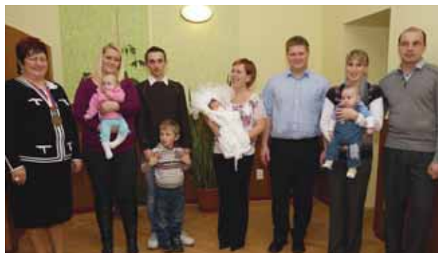
Vítání nových občánků jsme zahájili hned po uzávěrci loňského zpravodaje 4. prosince 2011