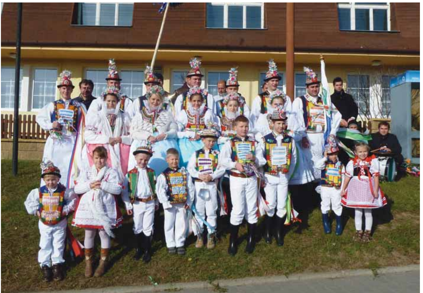
Letošní stárci s dětmi