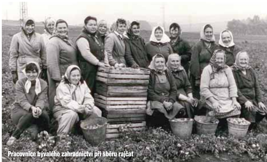
Pracovnice bývalého zahradnictví při sběru rajčat