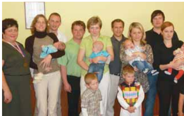
Vítání občánků 25. března 2012