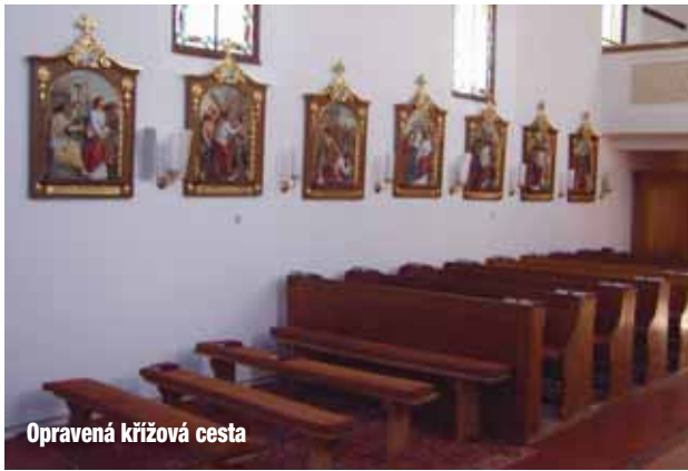
Opravená křížová cesta

Taktéž chci vyjádřit vřelý dík paní starostce Vlastě Mokré a zaměstnancům obecního úřadu za veškerou pomoc během oprav i za celoroční sečení parku u kostela. A nemenší dík patří všem, kdo