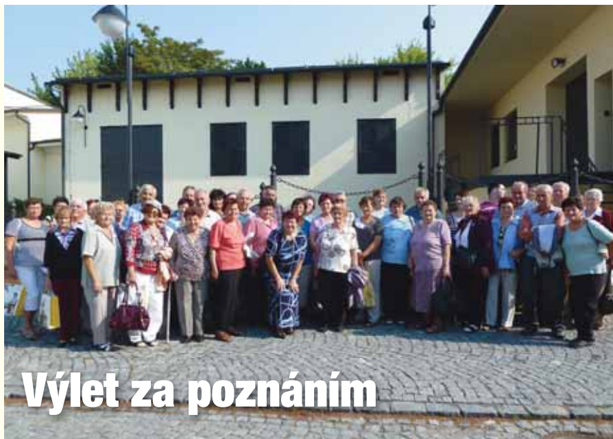
Výlet za poznáním