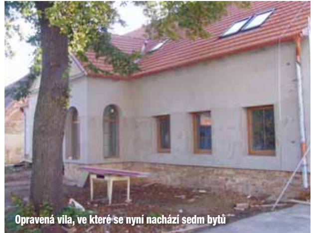
Opravená vila, ve které se nyní nachází sedm bytů