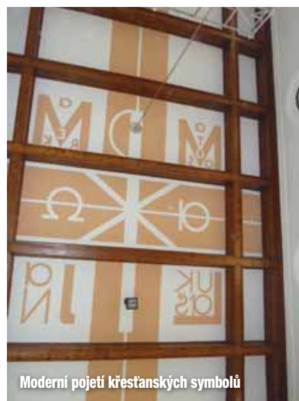
Moderní pojetí křesťanských symbolů

Při této příležitosti byl interiér kostela znovu vymalován. Výmalba, hlavně stropní část, velmi zdařile doplňuje stavební styl kostela.