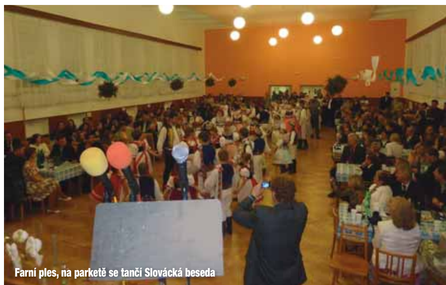
Farní ples, na parketě se tančí Slovácká beseda

V sobotu 4. února se v našem kulturním domě konal tradiční Krojovaný ples, který byl zároveň druhým Farním plesem farností Žarošice, Lovčice a Archlebov. A Násedlovičtí byli milými, pohostinnými a šikovnými pořadateli, což s díky ocenili účastníci z okolních obcí. K přátelské náladě a tanci přispěla dechová hudba Šardičanka, do opravdu bohaté tomboly přispěla řada sponzorů, farníků a lidí dobré vůle. Nechyběly ani výtečné plesové speciality na zub. Příští Farní ples by měl být na Katolickém domě v Žarošicích v sobotu 2. února 2013.