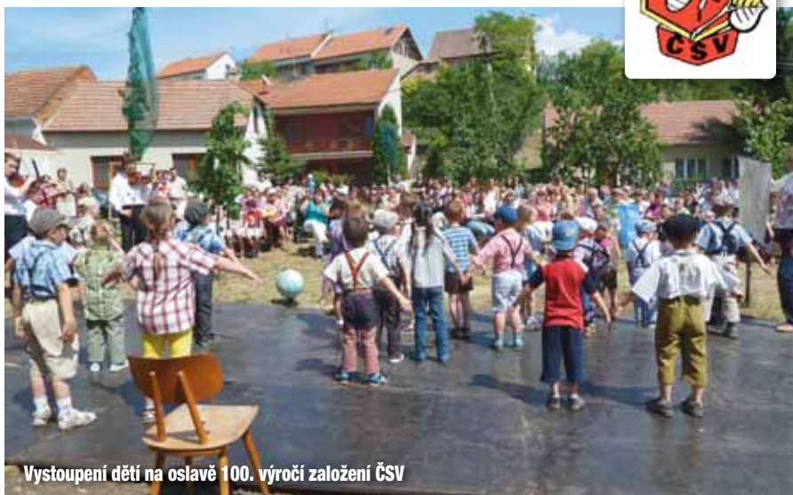
Vystoupení dětí na oslavě 100. výročí založení ČSV

V letošním roce oslavil náš včelařský spolek 100 let. Ustavující schůze se konala 12. března 1912 v Žarošicích. V současné době do včelařského svazu patří obce Žarošice, Silničná, Zdravá Voda, Uhřice a Násedlovice. Dne 27. května bylo uspořádáno slavnostní odpoledne ke stému výročí, na kterém vystoupili hosté, děti z mateřské školy a pěvecký sbor z Násedlovic za doprovodu cimbálové muziky. Paní Otradovcová předváděla zdobení perníků a zájemci si mohli vyzkoušet svou zručnost. Dále zde byla ochutnávka medoviny od včelařů, a tak všichni mohli ochutnat různé druhy. Ve včelařském domě si lidé mohli prohlédnout stálou výstavu včelích úlů. Byly zde i fotografie z různých období, ze zájezdů, plesů a akcí, se spoustou včelařů včetně těch, co již zemřeli, a tak si na ně mohli mnozí zavzpomínat. Dále zde probíhalo promítání krátkých filmů o medu a se včelařskou tematikou spojené s výkladem. Vedle starého medometu na ruční pohon byl vystaven i moderní elektrický medo-