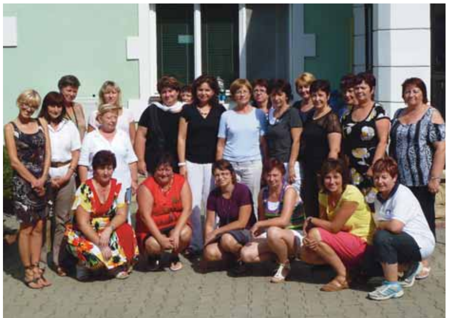
Setkání starostek a místostarostek okresu Hodonín na hájence v Haluzicích