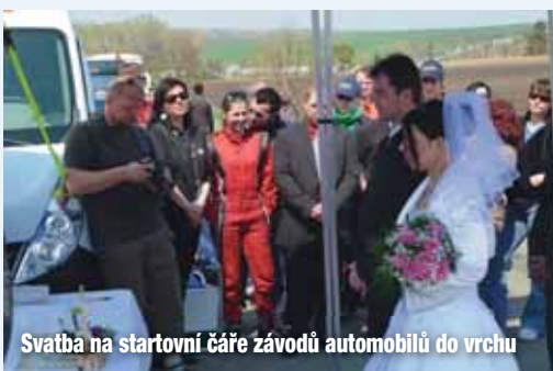
Svatba na startovní čáře závodů automobilů do vrchu

O tom, že řád templářských rytířů vlastnil na našem katastru obec Šenstrás, píšeme ve zpravodaji na jiném místě. Vesnice měla duchovní správu i hřbitov, a tak za dobu její existence se zde konaly jistě svatby i pohřby. Po zániku obce se na místo zapomnělo a jistě by i nějaká připomínka těchto dob byla na místě.